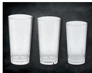
POLYBECHER PET »WGS«