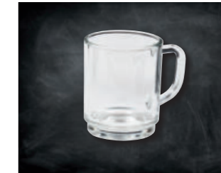
KAFFEE- / GLÜHWEINTASSE »NEUTRAL«