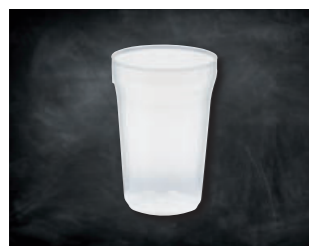
COCKTAILBECHER PET »NEUTRAL«