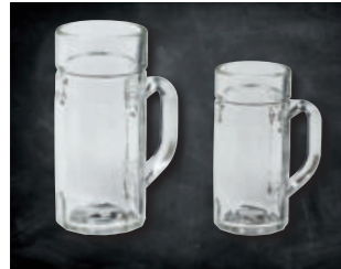
MOLDAU SEIDEL »NEUTRAL«